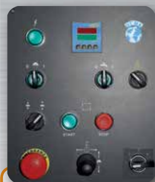
Panneau avec claire commandes d'utilisation